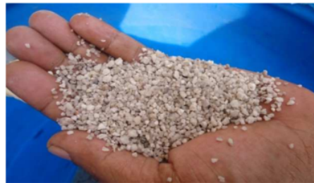
Gambar 3. Photo pasir silica diameter 1,95 mm