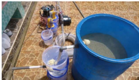
Gambar 2. Photo Gravel Bed Flocculator